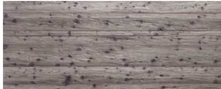
433 imi-altholz grau gehackt