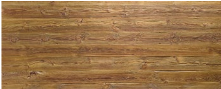
435 imi-altholz sonnig rustikal