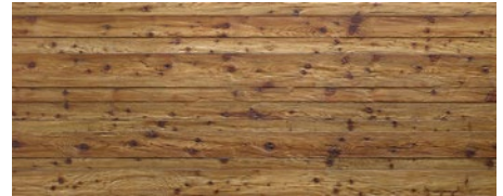
434 imi-altholz dunkel gehackt