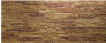
436 imi-altholz Eiche geriegelt