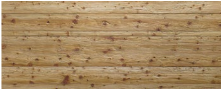
432 imi-altholz hell gehackt