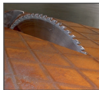
Bearbeitung mit normalen HM-Werkzeugen