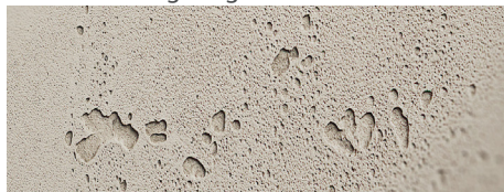
120 imi-beton glatt grau