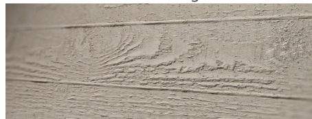
122 imi-beton Brettschalung