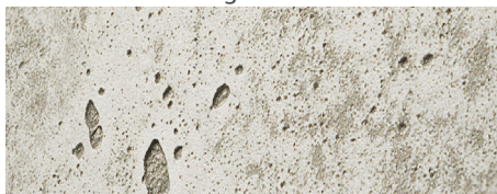
224 imi-beton Vintage standard