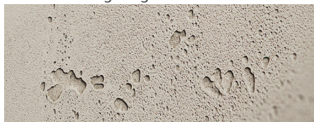
120 imi-beton glatt grau