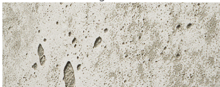
224 imi-beton Vintage standard