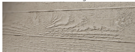
122 imi-beton Brettschalung